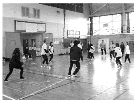
予選リーグの試合の様子