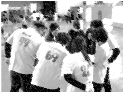
試合前、円陣を組んで気合を入れる