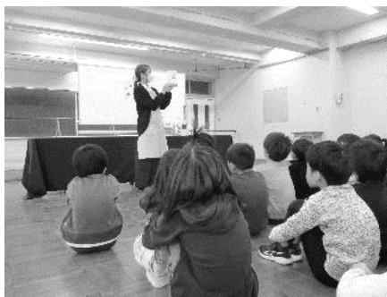
3・4年生ブックトーク