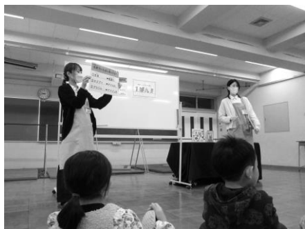
1・2年生ブックトーク