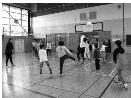
特別試合：2年Pvs4～6年子ども