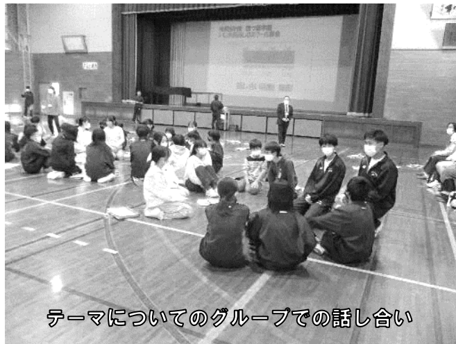
テーマについてのグループでの話し合い