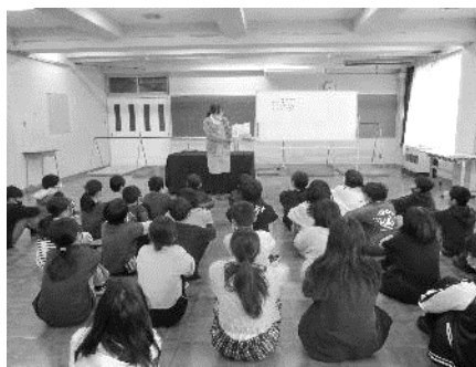
5・6年生ブックトーク

11月6日(月)から11月24日(金)は、校内読書週間です。読書週間中の11月13日(月)に、三条市立図書館の方による訪問ブックトークが行われました。子どもたちは、市立図書館の方の読み聞かせに集中して聞き入っていました。