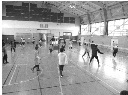
予選リーグの試合の様子