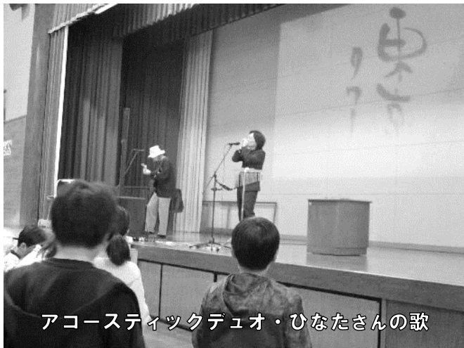
アコースティックデュオ・ひなたさんの歌

令和 5年 11月 24日(第9号) 三条市立保内小学校(児童101名) 〒955-0022 三条市上保内乙 500 TEL.0256(38)8313 FAX. (38)1471